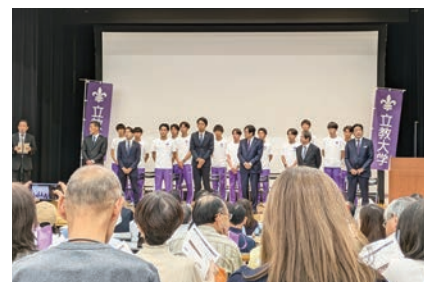
箱根駅伝予選通過報告・激励会