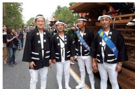
一番左が私です。だんじり祭りで。

出身は東京ですが、横浜に住むのはこれが初めてとなります。会のメンバーのみささまに横浜暮らしについていろいろとご指南いただきたいと思います。何卒、よろしくお願い申し上げます。