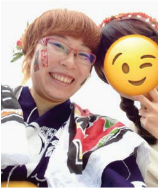
2014年夏学部の友達と