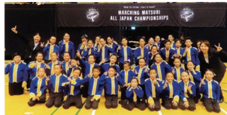
中田ジュニアマーチングバンドのメンバー