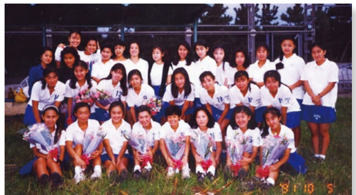
立教大学ラクロスの仲間たち。