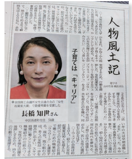
タウンニュースにも掲載されました。

この度の受賞は、女性が一旦家庭に入っても家事や育児を積極的なキャリアとして戻れる社会、女性が当たり前に取り組むことのできる社会を目指してきた「ララワーク」、「ララ・コンシェルジュ」等の取り組みが評価されたことと考えています。受賞をきっかけに職業紹介を行う「ララワーク」の登録者が月に300人ほど増えています。人材不足の中、専門的なスキル(例人事、経理)があれば50～60代でも就職は可能です。支援の一つとして社会保険労務士実務講座の研修を4月から開く予定です。